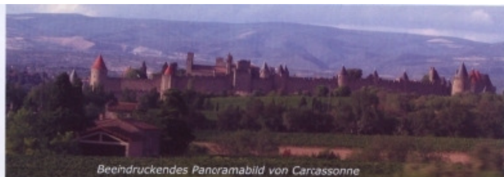
Beeindruckendes Panoramabild von Carcassonne