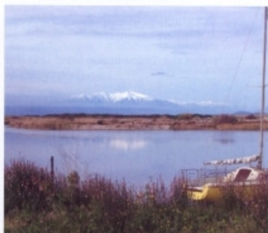
Blick von Aphrodite auf die Pyrenäen (im März 2007)

mit Supermarkt, einer Bäckerei, einem Fleischer, einem Weinhändler, einem guten Fischrestaurant, einer ausgezeichneten Pizzeria, einem Geschäft für Zeitschriften und Urlaubsartikel, und noch mehr. Am Strand lädt ein großes Restaurant mittags und abends zum Schlemmen oder auch nur nachmittags auf einen apéro ein. Man kann natürlich auch das im benachbarten Oasis gelegene Restaurant La Palmeraie besuchen. Es ist schon ein besonderes Vergnügen, nackt in der Sonne zu sitzen und bei einer pression dem Treiben im daneben gelagerten Swimmingpool zuzusehen. Oder man bestellt sich eine der köstlichen Pizzas, bei deren Zubereitung im Pizzaofen man auch zusehen kann, und lässt sie sich - vielleicht noch mit einem pichet Rosé aus den Corbières schmecken.