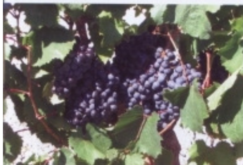
Auch der hervorragende Wein ist ein Grund, das Languedoc-Roussillon zu lieben

Sonntage im Jahr zählt man hier durchschnittlich. Das FKK-Dorf besteht aus ein- und zweigeschossigen kleinen Apartment-Häuschen in landestypischer, sehr anmutiger Bauweise, die zum großen Teil von ihren Eigentümern oder der Anlage selbst vermietet werden. Allerdings bleibt auch eine immer größer werdende Zahl von Leuten einen Großteil des Jahres in dieser grünenden und blühenden, sehr gepflegten Anlage.