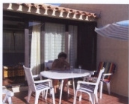
Auf der Terrasse des Ferienhäuschens

Sonntage im Jahr zählt man hier durchschnittlich. Das FKK-Dorf besteht aus ein- und zweigeschossigen kleinen Apartment-Häuschen in landestypischer, sehr anmutiger Bauweise, die zum großen Teil von ihren Eigentümern oder der Anlage selbst vermietet werden. Allerdings bleibt auch eine immer größer werdende Zahl von Leuten einen Großteil des Jahres in dieser grünenden und blühenden, sehr gepflegten Anlage.