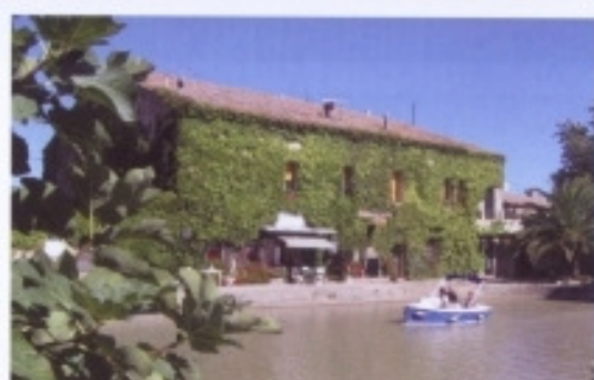
Am Canal du Midi